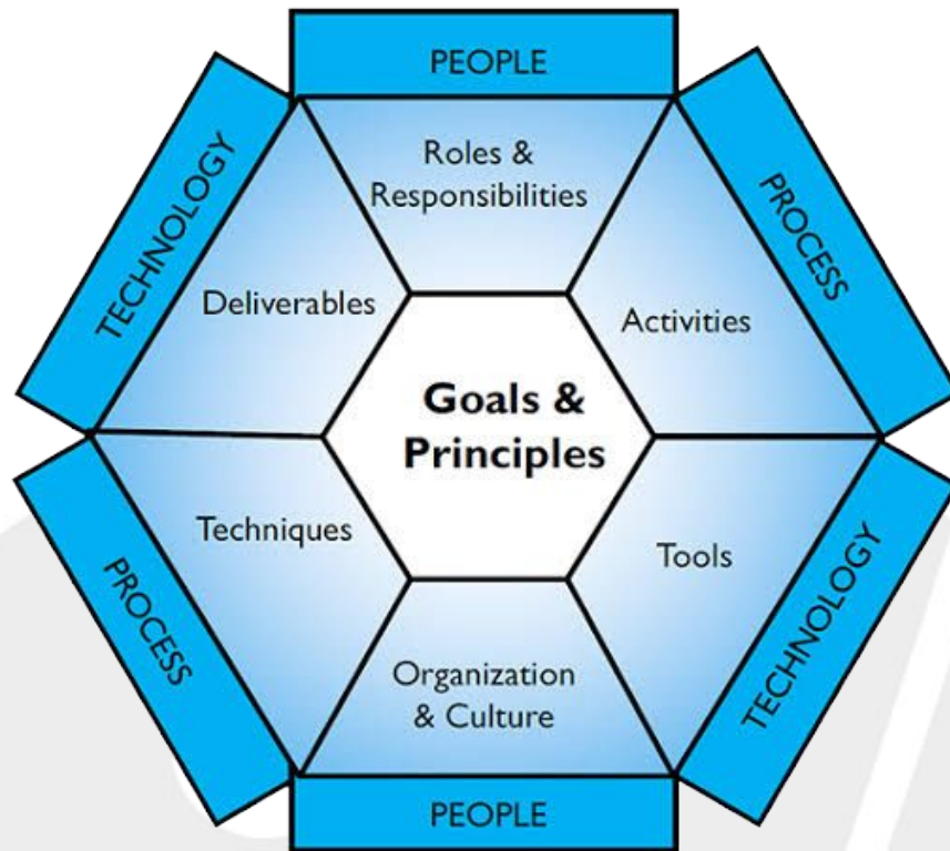
Figura 2. Hexágono de Factores Ambientales

Finalmente, cada área de la DAMA se desglosa en los tres factores representados en la Figura 2, para definir lo siguiente: